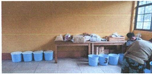
Foto 3: en el centro educativo se cuenta con espacio para remodelar el área de cocina, no se cuenta con los pollos y nesas de concreto para colocar los utensilios que se usan en la cocina