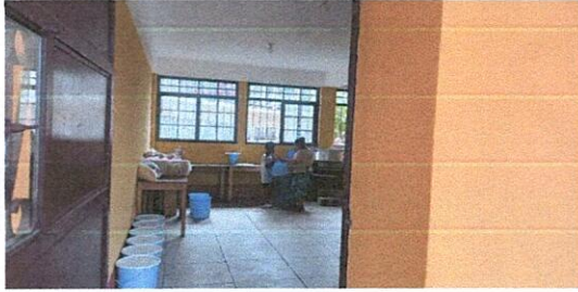
Foto 1: la conicna necesita tener gabinetes de concreto para colocar los utensilios de cocina