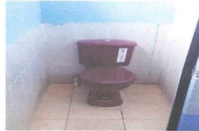
Foto 4 Sustitución de sanitarios de china y accesorios