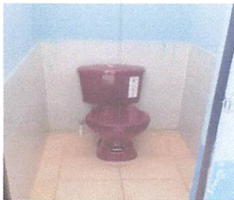
Foto 5 sustitución de sanitarios de china y accesorios