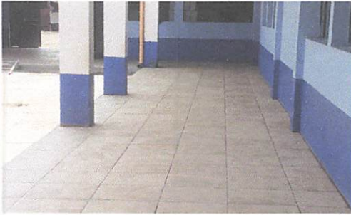
Foto 1 Sustitución de piso dañado por piso ceramico antideslizante