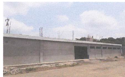
Foto 6 Reparación de repello y cernido en paredes

Observación: Si es necesario se pueden agregar hojas adicionales y actualizar el número de hojas.