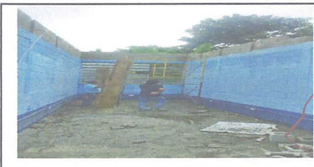
Foto 6: Levantado de pared para desnivel de techo

Observación: Si es necesario se pueden agregar hojas adicionales y actualizar el número de hojas.