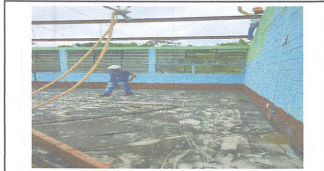
Foto 1. Techo módulo 1