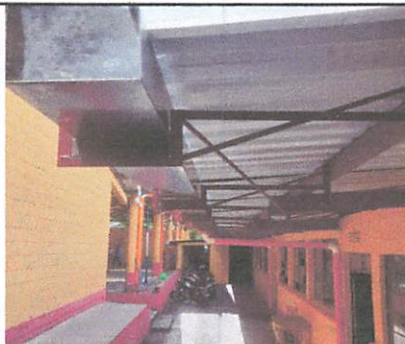
FINALIZACIÓN DEL PROYECTO. CANALETAS