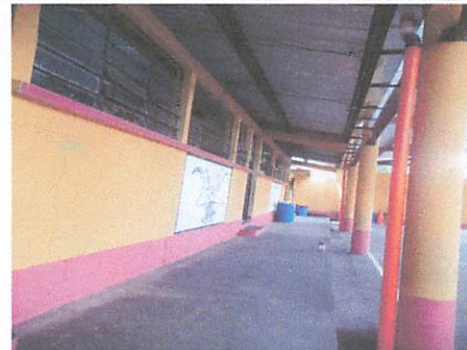
FINALIZACIÓN DEL PROYECTO. BAJADAS DE AGUA