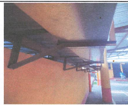
FINALIZACIÓN DEL PROYECTO. CANALETAS

Observación: Si es necesario se pueden agregar hojas adicionales y actualizar el número de hojas.