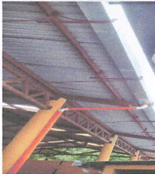
FINALIZACIÓN DEL PROYECTO. BAJADAS DE AGUA