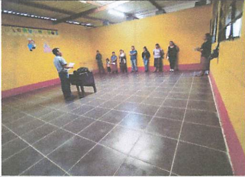
FINALIZACIÓN DEL PROYECTO. PISO.