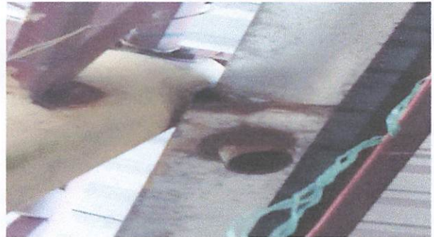
Accesorio de canaletas en mal estado.

Observación: Si es necesario se pueden agregar hojas adicionales y actualizar el número de hojas.