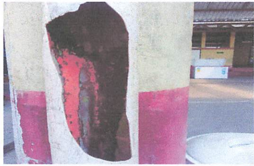
Bajadas de agua quebradas por eluso.