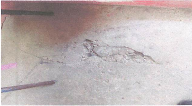
Deterioro del piso dentro del aula.