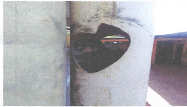
Bajadas en mal estado.