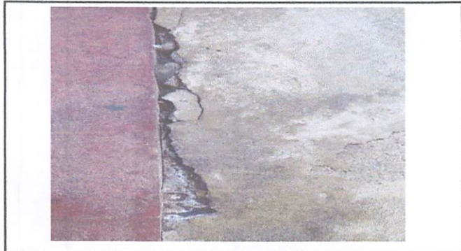
Foto1: Cambio de piso lizo a ceramica.