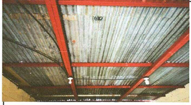
Foto: Lámina en malas condiciones