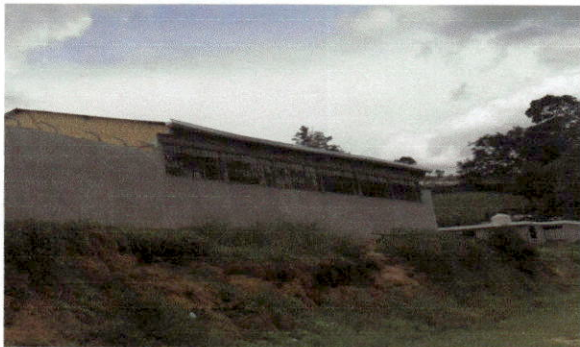
Foto 5: Finalización de repello de las dos aulas en la parte de atrás.