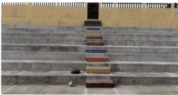
Foto 3: Gradas en buen estado después de la finalización de trabajo.