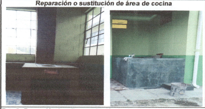
Foto 5: Reparación de pollo y sustitución de plancha por deterioro y cambio de chimenea de lata por chimenea de ladrillo. Elaboracion de pila de 2 lavaderos.