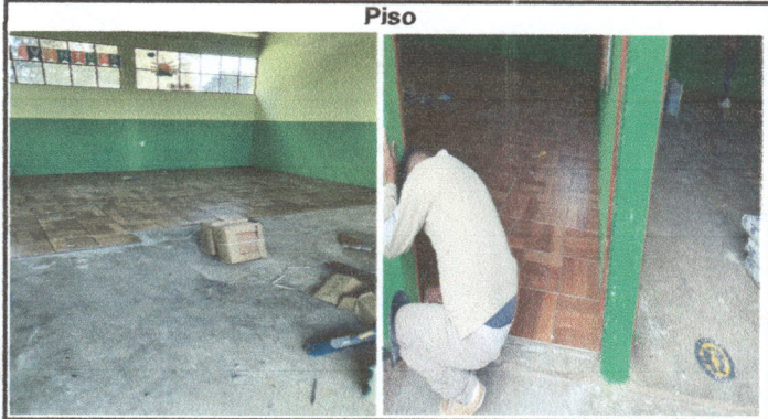
Foto1: Sustitución de torta alisada por piso.