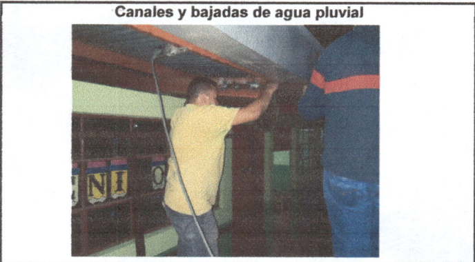
Foto 2: sustitución de canal de tubo pvc por canal alumizinc Sustitución de tubos de bajada por deterioro.