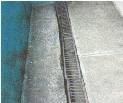
Foto 3: Fabricación y sustitución de parrilla metálica por deterioro.