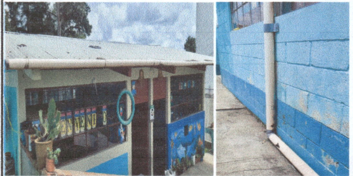
Foto 2: sustitución de canal de tubo pvc por canal alumizinc Sustitución de tubos de bajada por deterioro.