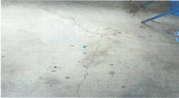
Foto1: Sustitución de torta alisada por piso.