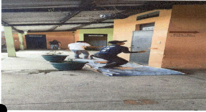
Foto1: Pintura en muros interiores y exteriores