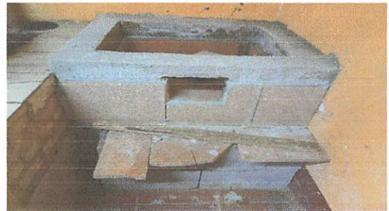
Foto 6. Ampliación de estufa de leña.

Observación: Si es necesario se pueden agregar hojas adicionales y actualizar el número de hojas.