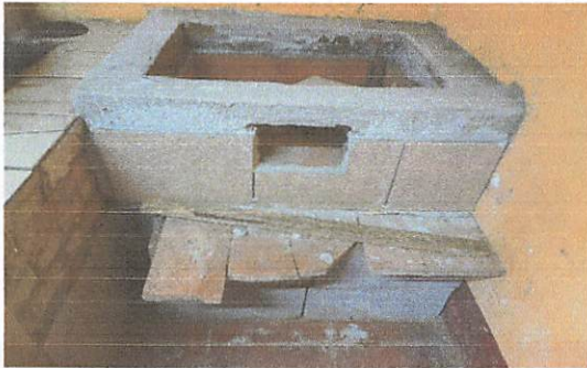
Foto 5. Ampliación de estufa de leña.