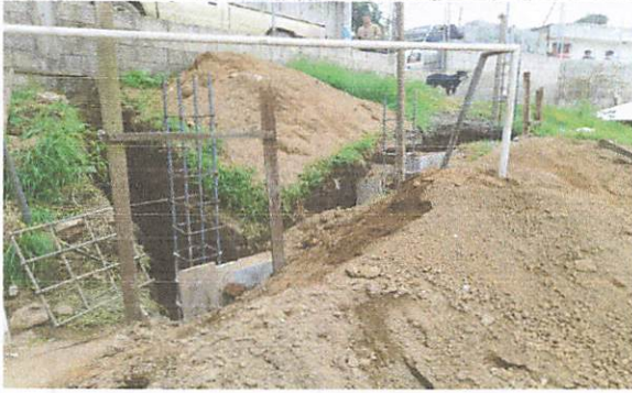
Foto 1 Remodelación de sanitarios.