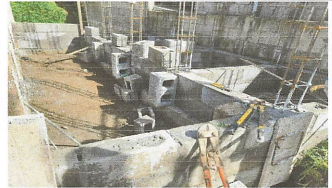
Foto 2. Remodelación de sanitarios.