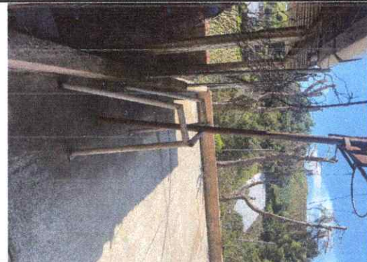
Foto 4: Sustitución de muro de mampostería y malla en mal estado frente a la cocina, sustitución por electro malla