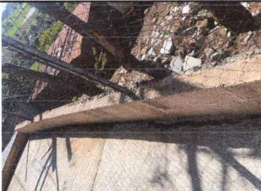
Foto 3: Reparación de muro de contención necesidad de regilla para evacuación de agua pluvial