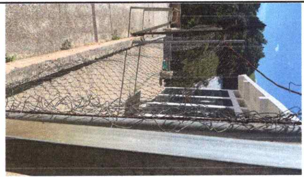
Foto 6: Sustitución de muro de mampostería y malla en mal estado del lado de los sanitarios, sustitución por electro malla

Observación: Si es necesario se pueden agregar hojas adicionales y actualizar el número de hojas.