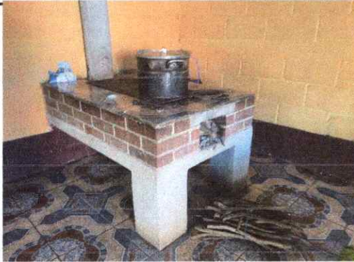
Foto1: Reparación de poyeton de cocina