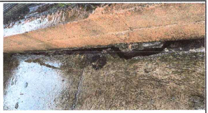
Foto 2: Grieta en el muro, carece de resistencia debido a que no tiene salida de evaluación del agua, demoler pavimento y reparación interna de muro de contención