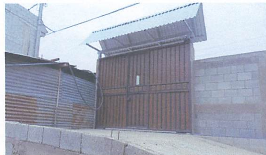
FOTO 6: Techado del Porton lado Sur entrada principal de la escuela con estructura metálica.

Observación: Si es necesario se pueden agregar hojas adicionales y actualizar el número de hojas.