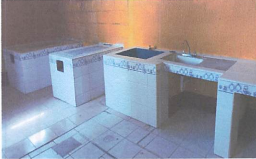
FOTO 1: Ampliación y construcción de dos planchas de cocina, lavatrastos, mesa de concreto y piso cerámico.