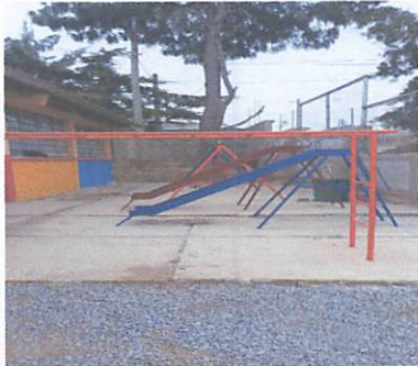
FOTO 5: Relleno para fundición de loza en el area de juegos infantiles.