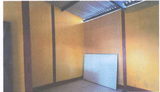
FOTO 2: Ampliación y construcción de un aula, colocación de piso cerámico.