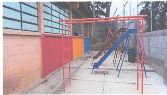
FOTO 4: Remodelación de juegos infantiles, y construcción de loza en el area de juegos infantiles.