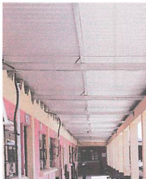
Foto 3: vista final de la estructura metálica y la lámina en los 500mts 2 de trabajo.