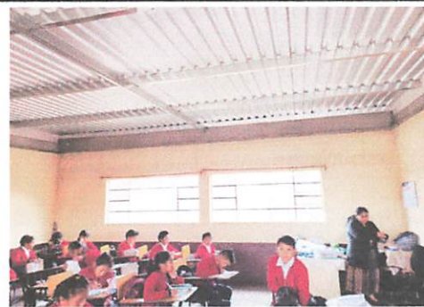
Foto 6: trabajo final de levantado de block dentro de las aulas. Trabajado con cernido.

Observación: Si es necesario se pueden agregar hojas adicionales y actualizar el número de hojas.