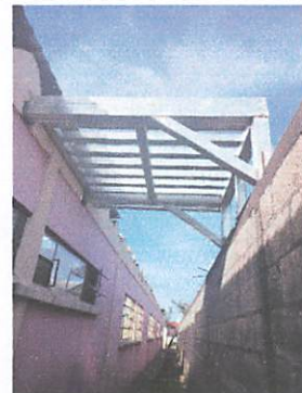
Foto 4: base de estructura metálica para colocación de depósito de agua para los sanitarios.