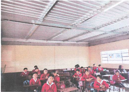
Foto1: cierre de espacios con divisiones entre aulas con tablayeso.