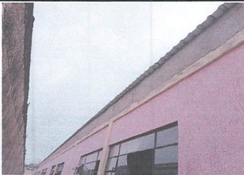
Foto 5: vista de la parte de atrás de las aulas en las que se levantó 2 hileras de block y se colocó cernido. Área trabajada 50mts lineales.