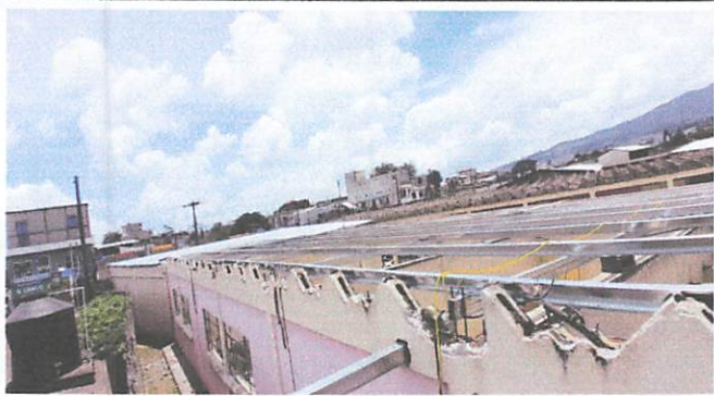
Foto 1: vista completa de toda la estructura metálica para la colocación de la lámina troquelada. Instalación en los 500mts 2 de trabajo.