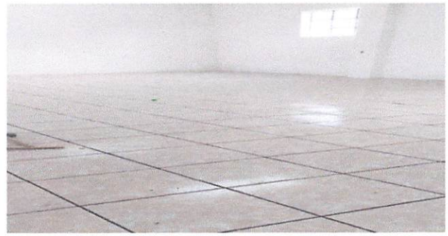
Foto 2: Parte de los salones 1 y 2 ya finalizados con la colocacion de piso ceramico.