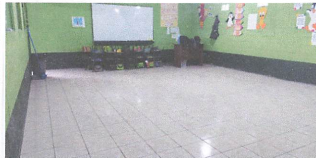
Foto 5: Es otra de las fotografías que indica la finalizacion de la colocacion de piso ceramico en los salones 3 y 4.