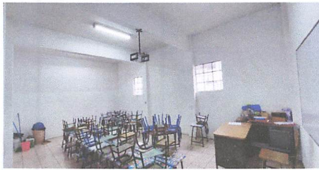
Foto1: Salones No. 1 y 2 ya finalizados y siendo utilizados por los niños de primero primaria secciones "A" y "B".