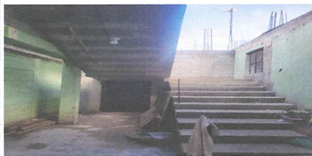
Foto 6: Gradas y bodega ya finalizados para dar acceso al segundo nivel.

Observación: Si es necesario se pueden agregar hojas adicionales y actualizar el número de hojas.