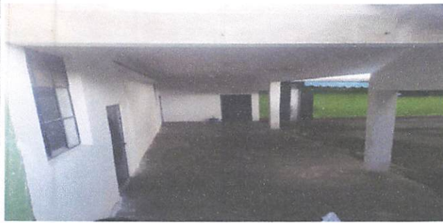
Foto 3: Parte del corredor que muestra el repello, tallado y cernido del corredor y de la pared.