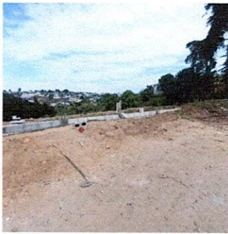
Foto 3: PAVIMENTACIÓN DEL LADO DE AFUERA DEL ESTABLECIMIENTO PARA QUE LOS ALUMNOS REALICEN EDUCACIÓN FÍSICA.