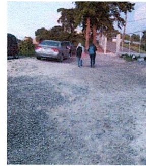
Foto 4: PAVIMENTACIÓN DEL LADO DE AFUERA DEL ESTABLECIMIENTO PARA QUE LOS ALUMNOS REALICEN EDUCACIÓN FÍSICA.