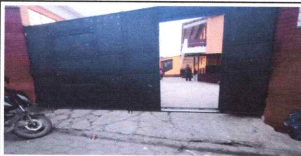
Foto 5: arreglar la bajadita de la entrada por mal estado, y han habido varios accidentes