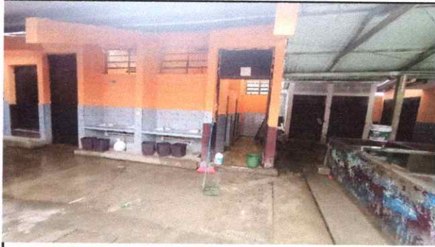
Foto1: arreglar tuvería de agua para los sanitarios