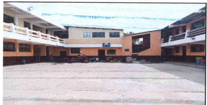
Foto 6: Se va arreglar el patio por acumulación de agua, se va sacar declive y colocar regias del lado derecho e izquierdo y tuverias para la salida de agua a la calle

Observación: Si es necesario se pueden agregar hojas adicionales y actualizar el número de hojas.