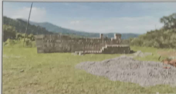
Foto 1: Material para reconstrucción de la cocina del centro educativo NUFED 162 de la comunidad unión victoria del Municipio de San miguel Pochuta