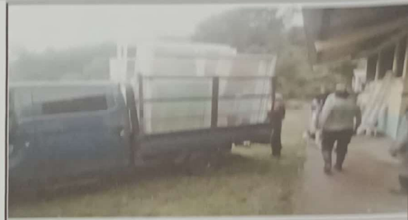
Foto 2: Entrega y colocación de las ventanas en el centro educativo.