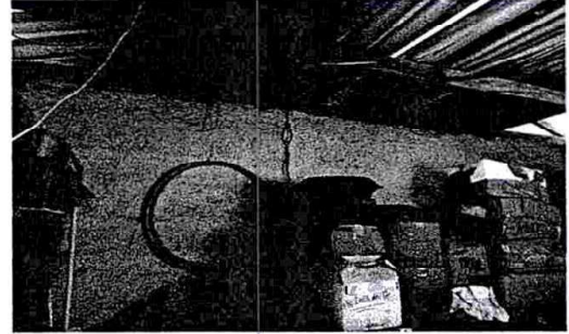
Foto 2: La bodega se convierte en cocina por ser mas amplia que la cocina actual.