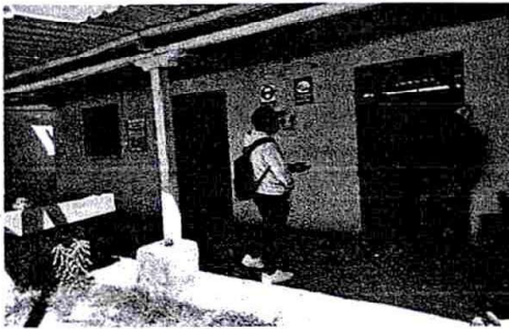
Foto 3: Se cambiará las costaneras de la cocina y bodega (de madera a metal)