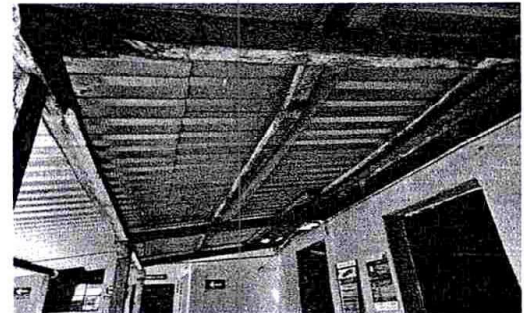
Foto 4: Se cambiará las costaneras del corredor en frente en de la cocina, bodega y las pilas