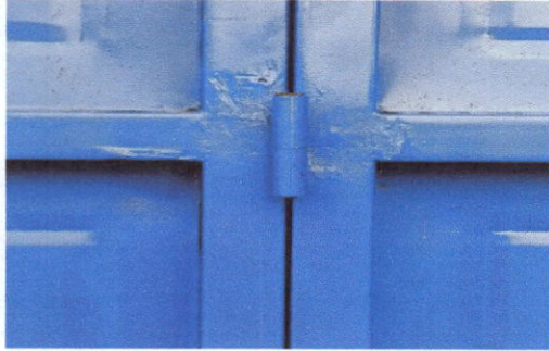
Foto1: Bisagras mejoradas del portón de entrada.