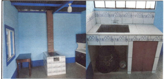
Foto 4: Estufa rural con plancha y chimenea mejoradas, implementación de ventana y lavatrastos.