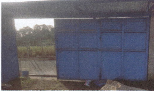
Foto1: Limpieza para reparación del portón de entrada.