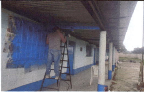
Foto1: Mantenimiento a costaneras.