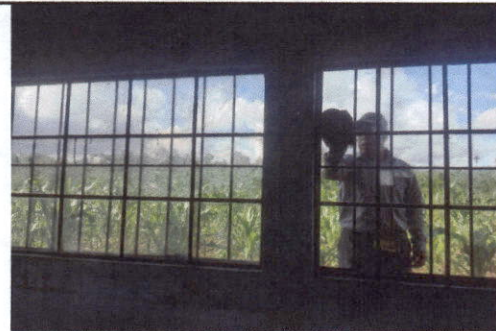
Foto 4: Limpieza y mantenimiento a ventanas y balcones deteriorados.