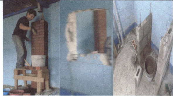
Foto 4: Sustitución de chimenea e implementación de ventana y lavatrastos en cocina.