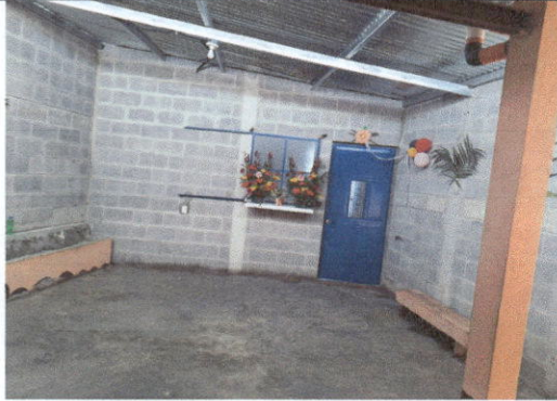
Foto1: Finalizado, terminación de pared.