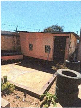
Foto1: Necesita terminación de pared.