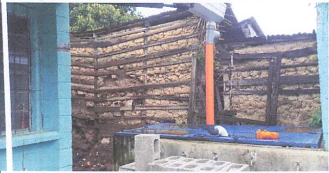
Foto 1: Fachada cocina: Descombrando, con vista de canales nuevos.