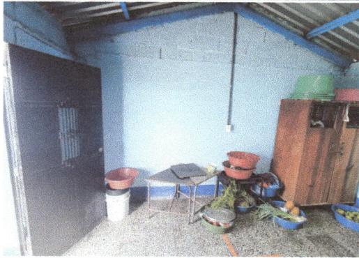
Foto 1: FALTA DE MESA DE TRABAJO PARA PODER COLOCAR INSTRUMENTOS DE COCINA