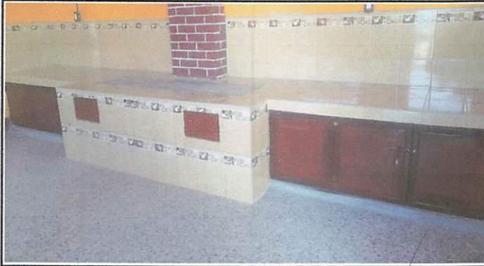
Foto1: Colocación de azulejo y remodelación de chimenea