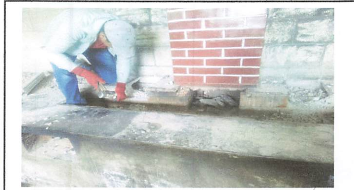
Foto1: Colocación de azulejo y remodelación de chimenea