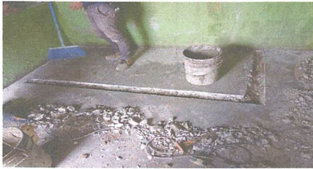
Foto13: inicio de los poyos bajos