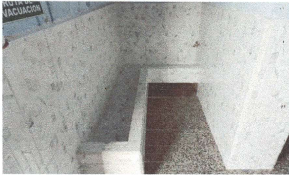
Foto 1: remodelacion de orinal en sanitarios varones 2m lineales 40 de ancho