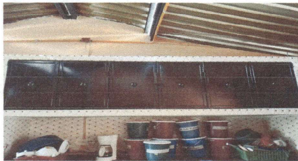
Foto 5: gavetero aereo en cocina 2.50 largo x 0.65 de fondo x 0.60 alto. Cimiento alto 1.75