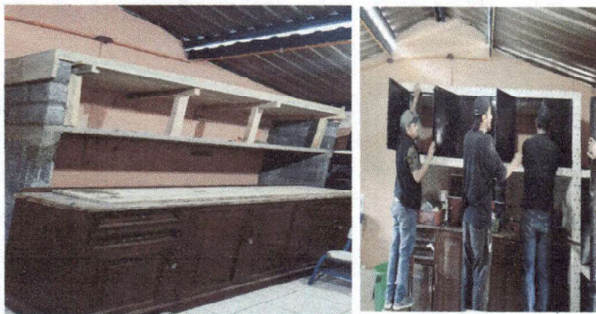
Foto 5: gavetero aereo en cocina 2.50 largo x 0.65 de fondo x 0.60 alto. Cimiento alto 1.75