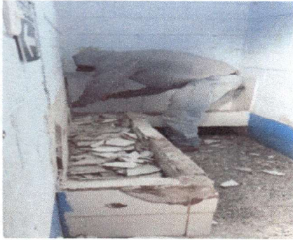
Foto 1: remodelacion de orinal en sanitarios varones 2m lineales 40 de ancho