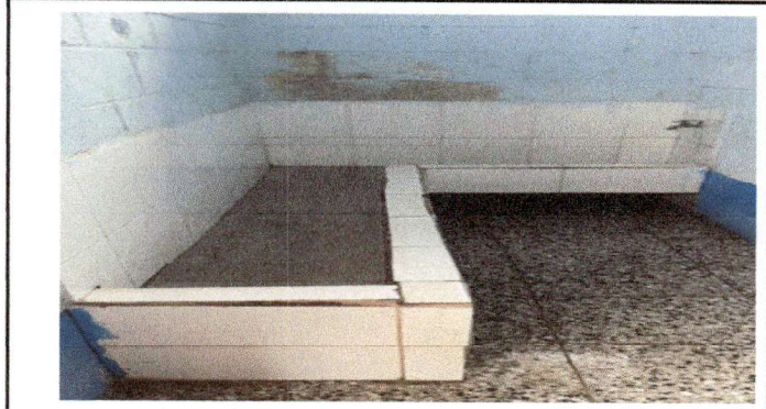
Foto 1: remodelacion de orinal en sanitarios varones 2m lineales 40 de ancho