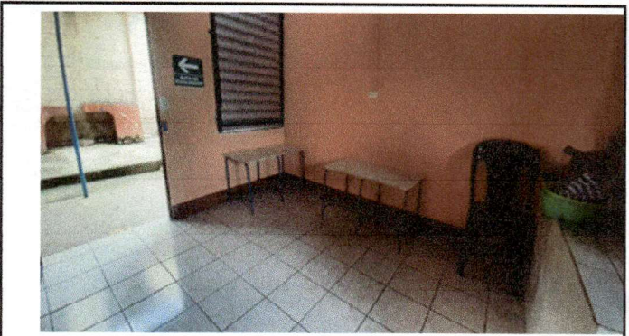
Foto 2: mesa de concreto en cocina .75 ancho x .55 alto x 2.35 largo