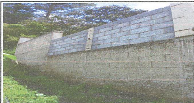
Ampliación de construcción de pared de circumbalación