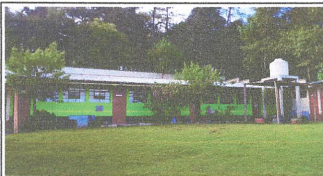
Pintada de las aulas interior y exterior