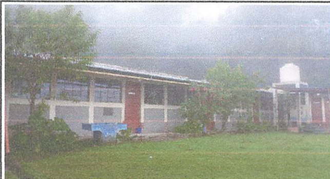
Cernido de paredes exterior de las aulas