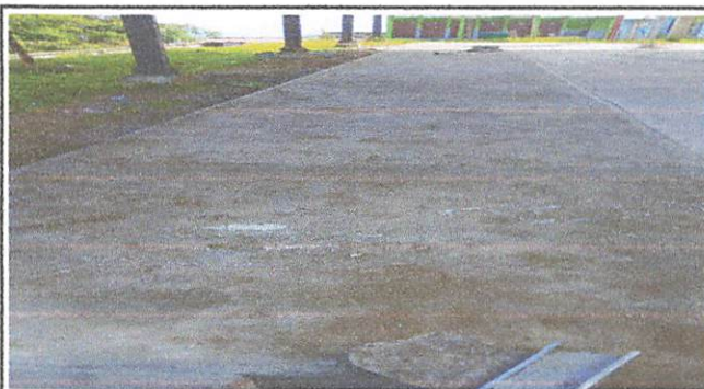
Cernido partes de la cancha