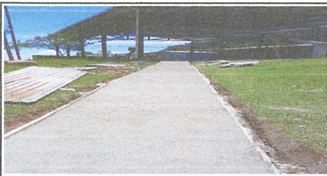
Culminación de cernido de entrada principal de la escuela

Observación: Si es necesario se pueden agregar hojas adicionales y actualizar el número de hojas.