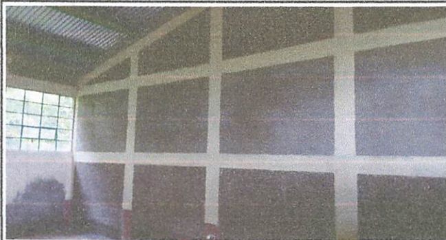
Cernido de paredes interior de las aulas.