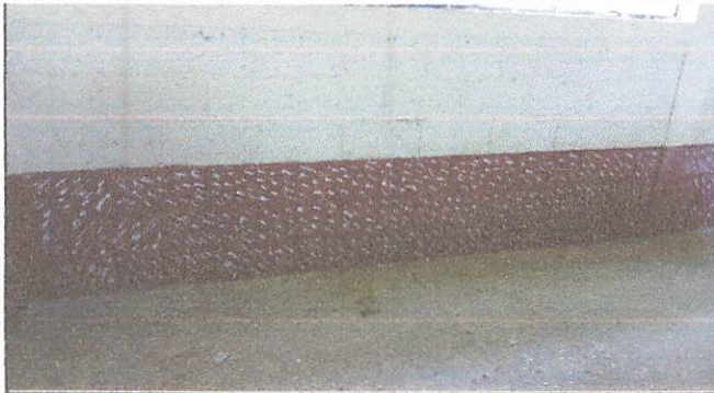
Picada de las paredes de aulas interior y exterior