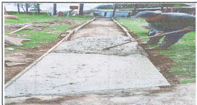
Fundición de la entrada principal de la escuela