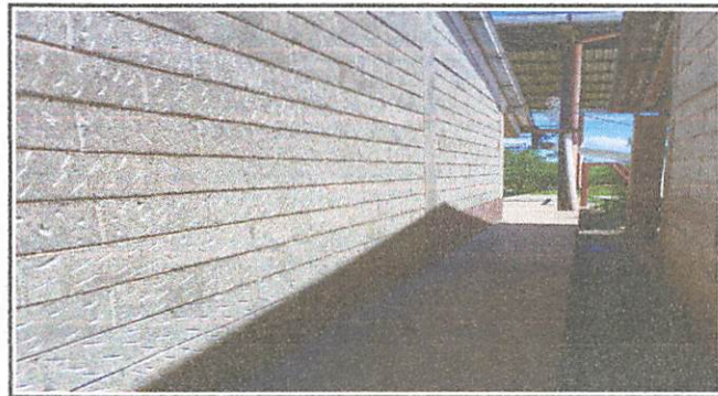
Inicio de picada de paredes de las aulas