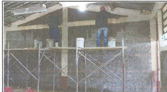
Inicio de savieta en interior de paredes de las aulas