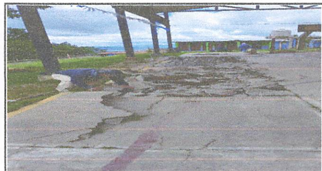
Levantado de concreto de la cancha con deteriorado.

Observación: Si es necesario se pueden agregar hojas adicionales y actualizar el número de hojas.