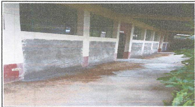
Inicio de savieta exterior de todas las paredes de aulas.