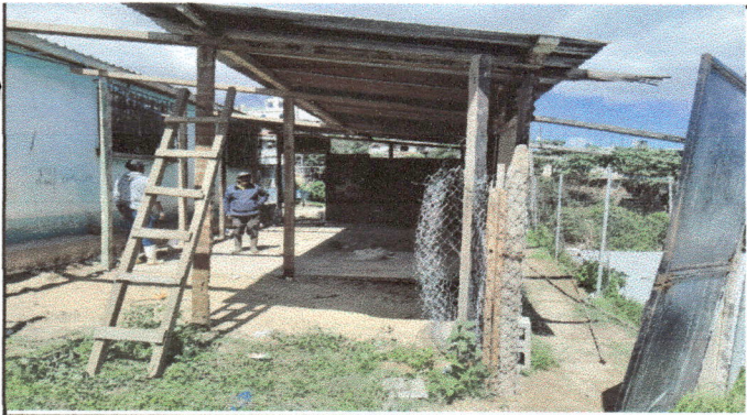
Foto 3: Espacio en destrucción de la galera para iniciar los trabajos de cocina.