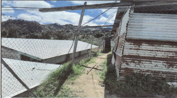
Foto 1: Espacio en donde se trabajará la cocina, anteriormente bodega de lamina.