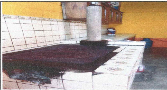
Foto 5: Área de Cocina La estufa para fuego, necesita cambio para la utilización adecuada.