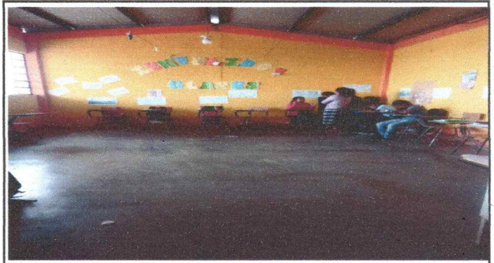
Foto 2: Piso del salón Segundo Nivel Desgastado y necesita mejora para el alumnado.