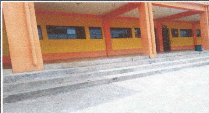
Foto 3: Corredor y gradas de las aulas Primer Nivel Pisos agujerados y gradas deterioradas, necesita mantenimiento.