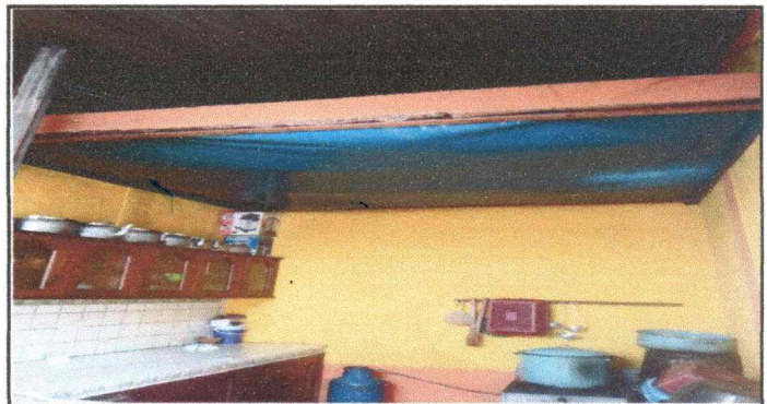
Foto 6: Techo de cocina Necesita botar el paredon para ampliar cocina y el techo de nylon necesita seguridad y mejor presentación.

Observación: Si es necesario se pueden agregar hojas adicionales y actualizar el número de hojas.