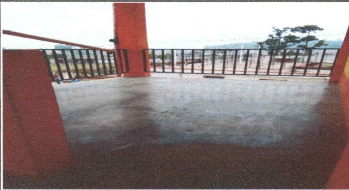
Foto 1: Piso del corredor del Segundo Nivel No está en buenas condiciones para los estudiantes, necesita mejoras.