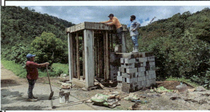
Foto1: Area para terraza para deposito de agua.