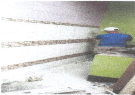
COLOCACION DE AZULEJO EN LA COCINA