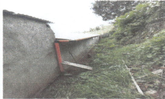
REPELLO DE COCINA