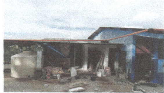
CAMBI DE PISO EN EL CORREDOR

Observación: Si es necesario se pueden agregar hojas adicionales y actualizar el número de hojas.