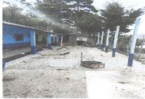
TECHO DE PATIO PRINCIPAL