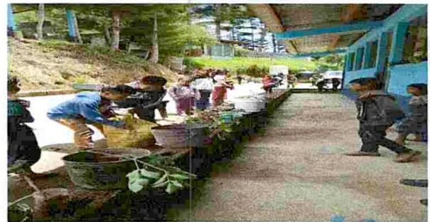
COLOCACION DE PISO CERAMICO

Observación: Si es necesario se pueden agregar hojas adicionales y actualizar el número de hojas.