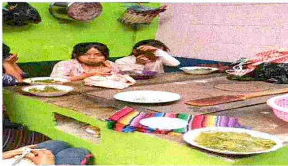
CAMBIO DE PLANCHAS