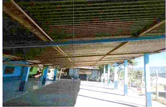
TECHO DE PATIO PRINCIPAL