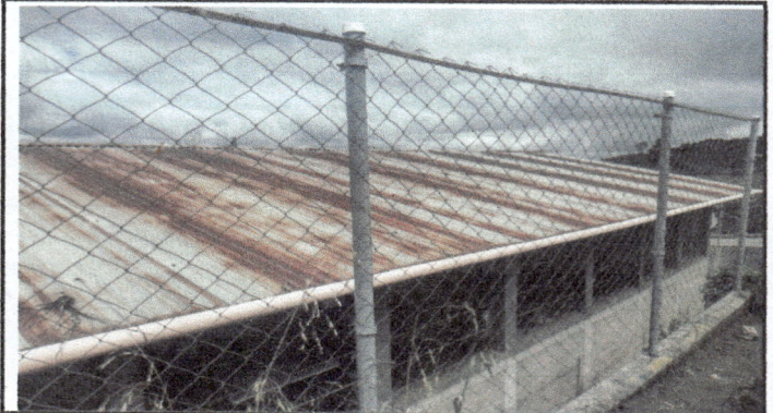
Foto 2: Sustitución de láminas por deterioro y filtración de agua y costanera