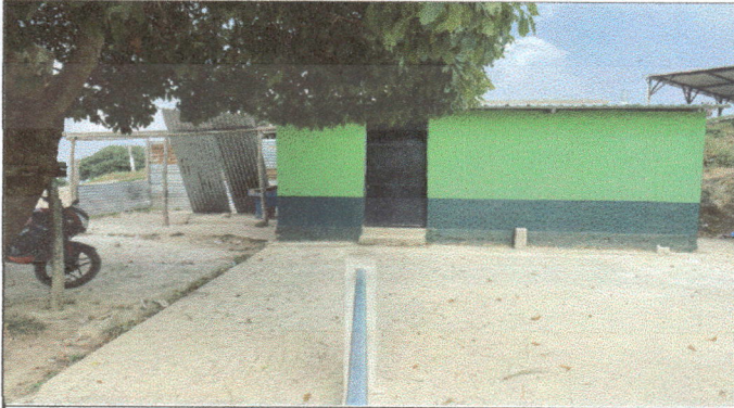
Foto1: como estaba