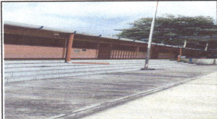
canales y piso contra huella