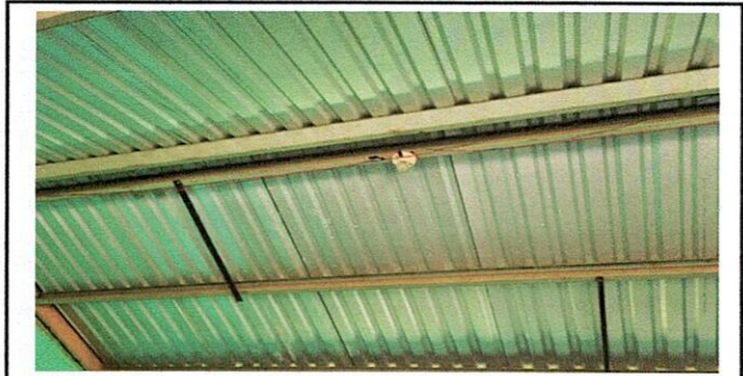
Cambio de instalación eléctrica con un total de 125 metros, focos y tomacorrientes.