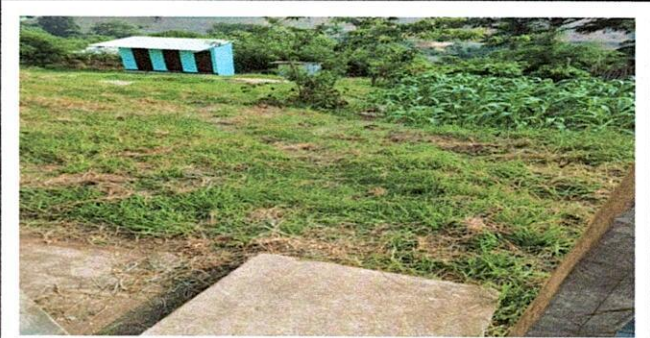
Segunda face de emparejamiento y pavimentación de camino hacia los sanitarios con un largo de 23 metros por 1 metro de ancho y un grosor de 9 centímetros