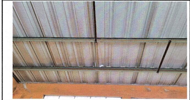
Cambio de techo para direccion, 1 salon y bodega, total 72 metros2 Instalación de cielo falso para 1 salón y dirección, total 54 metros 2