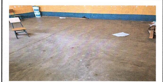
Instalación de piso cerámico en 1 salón y dirección con un total de 44 metros2