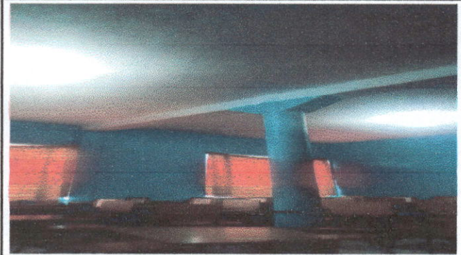
REPARACIÓN DE SISTEMA ELECTRICO: sustitución de cableado y alumbrado de 5 aulas