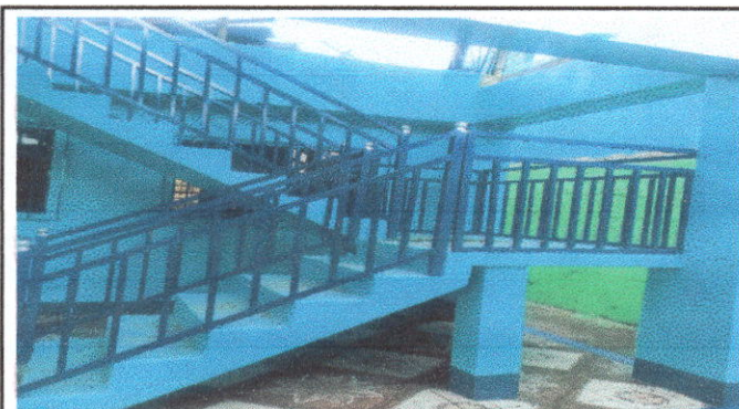
MANTENIMIENTO DE BARANDA: Sustitución de baranda.