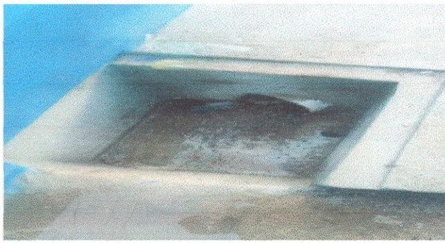
REPARACION DE RED DE DRENAJES Y AGUA POTABLE: Instalacion de drenaje y cambio de chorros.