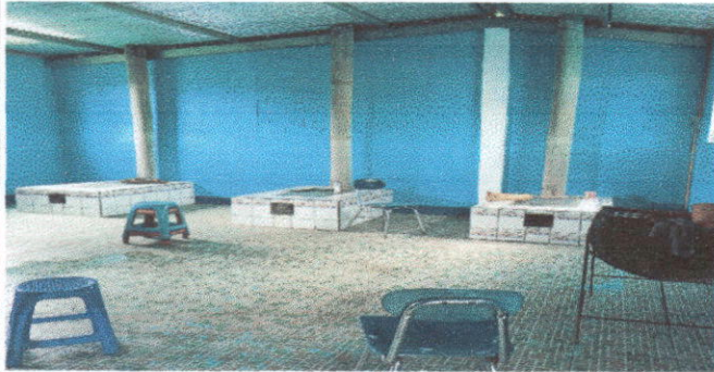
SUSTITUCION DE AREA DE COCINA: Sustitución d eplancas de estufa de leña , compra de un lavaplatos, sustitución de chapa.