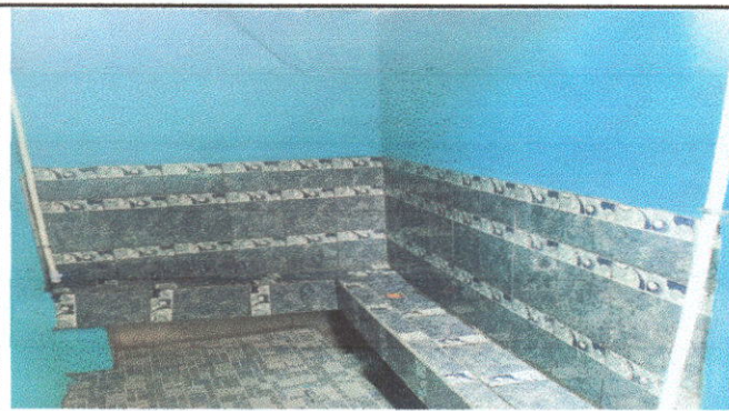
SERVICIO SANITARIO Y ACCESORIO: Sustitución de inodoro, construcción de mingitorio, sustitución de puertas (4 sanitarios)