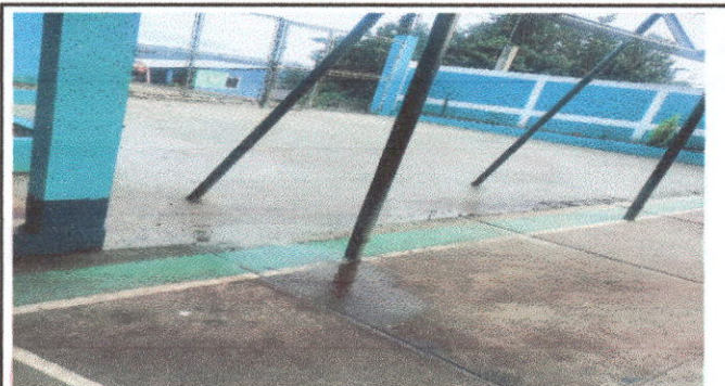
LOSA DE PATIO: pavimentación de entrada de la escuela.

Observación: Si es necesario se pueden agregar hojas adicionales y actualizar el número de hojas.