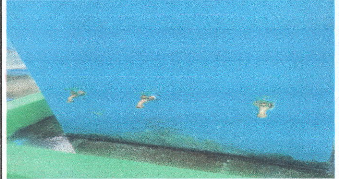
REPARACIÓN Y MANTENIMIENTO DE CISTERNA / DEPÓSITO DE AGUA: Cambio de llaves de chorrosy accesorios.