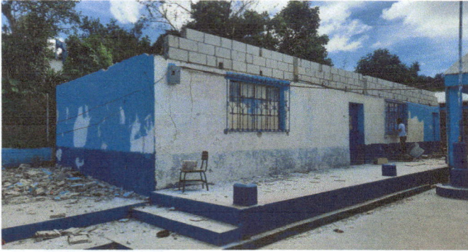
Foto1: Preparación de espacio para empezar los trabajos.