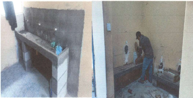
Foto 3: cambio de accesorios de sanitarios y cambio de lavamanos varones No. 6