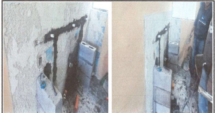
Foto 4: cambio de accesorios de sanitarios y cambio de lavamanos mujeres No. 8