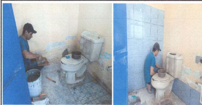
Foto 5: cambio de accesorios de baño de maestros y colocación de azulejos No. 7