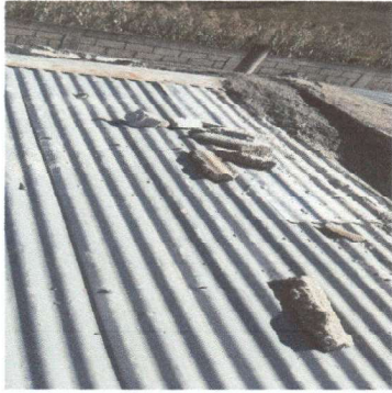
Foto1: arreglo de techo de lámina aula No. 3