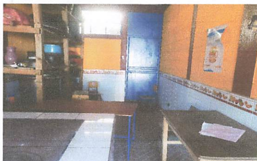
Foto 3: falta de espacios para picar y realizar los alimentos para los estudiantes