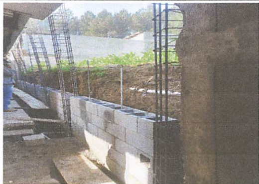
Foto1: reparación de muro de contención