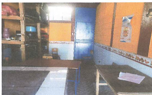
Foto 3: falta de espacios para picar y realizar los alimentos para los estudiantes