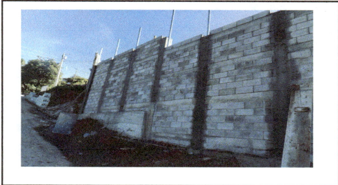
Foto1: Vista exterior de la pared remozada.