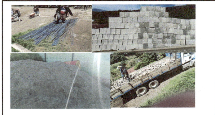
Foto 2: Compra de material, puesto en la Escuela Oficial Rural Mixta Aldea Chichoy