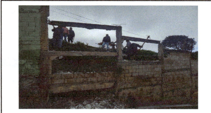
Foto1: Incio de trabajo, demolición de pared.